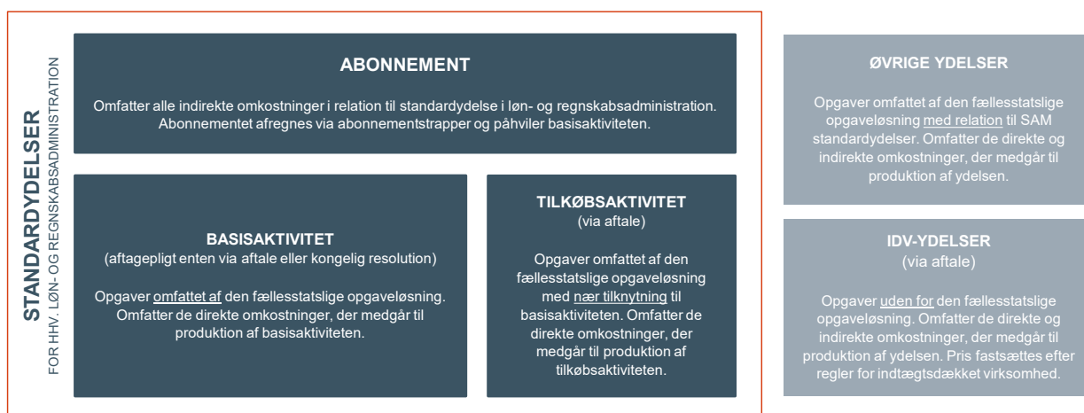
Figur 1: Prismodellens ydelses- og omkostningsstruktur

Omkostningsstrukturen kan aflæses af figur 1, hvor det fremgår, at abonnements-elementet alene relateres til standardydelseerne og dækker de indirekte omkostninger, der medgår til produktion af disse ydelser. De direkte omkostninger afregnes for standardydelseerne på den enkelte aktivitet. Muligheden for at vælge tilkøbsaktiviteter forudsætter, at kunden allerede aftager basisaktiviteter hos Statens Administration. Der er en standardydelse for henholdsvis løn- og regnskabsadministration med særskilt abonnement.