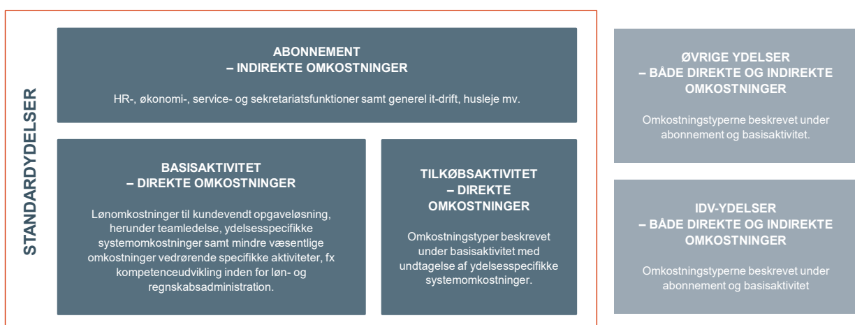
Figur 3: Prismodellens omkostningsfordeling og -indhold

I figur 3 fremgår det, hvordan direkte og indirekte omkostninger har sammenhæng med priserne for standardydelser (basisaktiviteter og tilkøbsaktiviteter) og IDV, herunder hvilke omkostningstyper der indgår i direkte og indirekte omkostninger.