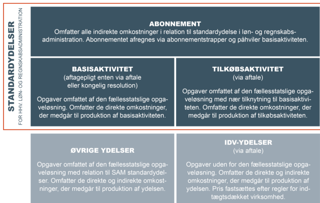
Figur 1: Prismodellens ydelses- og omkostningsstruktur

Omkostningsstrukturen kan aflæses af figur 1, hvor det fremgår, at kunder, der aftager en standardydelse, afregnes en abonnementsbetaling, som dækker de indirekte omkostninger, der medgår til produktion af disse ydelser. De direkte omkostninger afregnes for standardydelseerne på den enkelte aktivitet. Muligheden for at vælge tilkøbsaktiviteter forudsætter, at kunden allerede aftager basisaktiviteter fra Statens Administration. Der er en standardydelse for henholdsvis løn- og regnskabsadministration med særskilt abonnement.