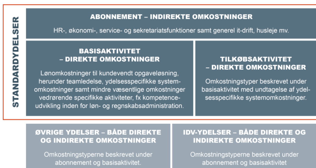
Figur 3: Prismodellens omkostningsfordeling og -indhold

I figur 3 fremgår det, hvordan direkte og indirekte omkostninger har sammenhæng med priserne for standardydelser (basisaktiviteter og tilkøbsaktiviteter) og IDV, herunder hvilke omkostningstyper der indgår i direkte og indirekte omkostninger.