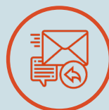
Fremsendelse af påmindelse og ledelsesrapport