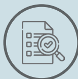
Kontrolgrundlag til manuel behand- ling hos kunden